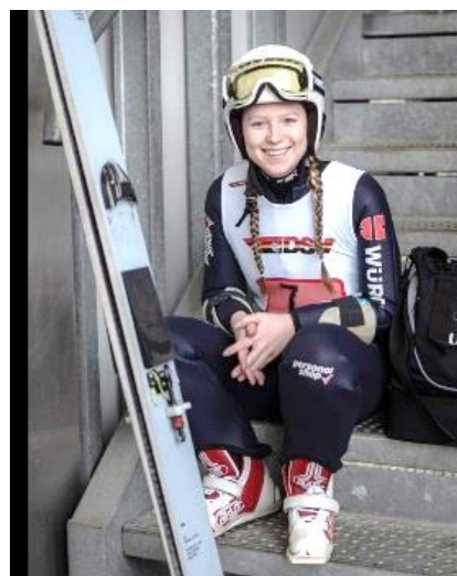
Skispringerin Emely Torazza freut sich auf die neue Saison.