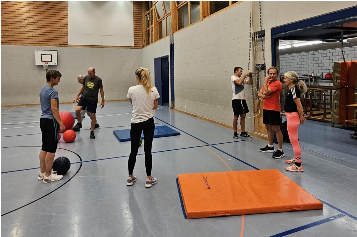
Das Skiturnen in der Turnhalle Schwändi wartet auf Dich!

Einladung zur 84. Hauptversammlung Freitag, 29. November 2024