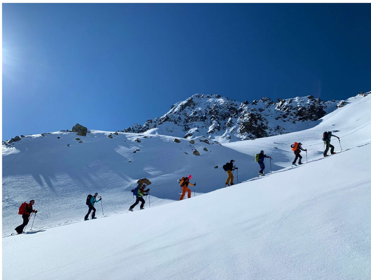
Fahrtstour 2025: Aufstieg zum Wörgetalgrat, 2600 m ü. M.